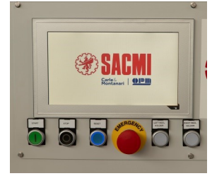
10" Color-Touch Bedienpanel