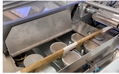
Drei (3) Rollenpaare, einstellbare Neigung des ersten Rollenpaares