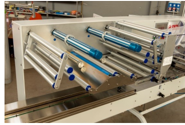
Autom. Film-Splicer (Option)